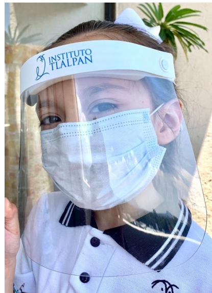
Ejemplos de caretas