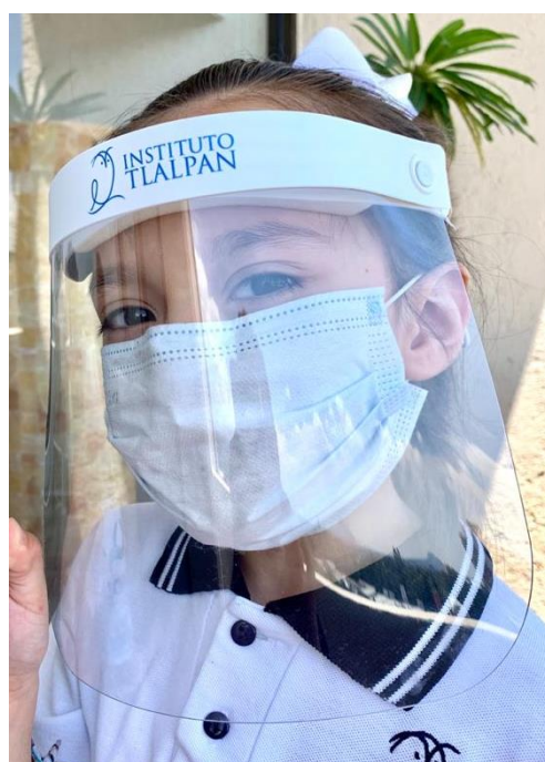
Ejemplos de caretas